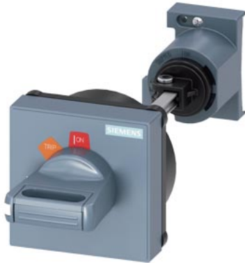
Door-coupling rotary operating mechanism For circuit breaker Size S00...S3, black 130 mm shaft