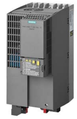
Podobné zobrazení Figure similar

Obj. č. : 6SL3210-1KE23-2UF1 Article No. :