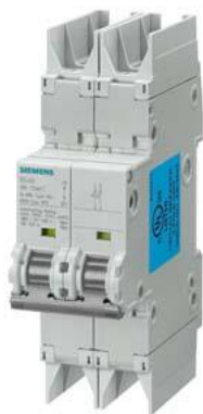
jistič 10kA, 2pól., C, 6A podle UL 489-480Y/277V