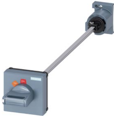
Door-coupling rotary operating mechanism For circuit breaker Size S00...S3, black 330 mm shaft