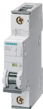
jistič 230/400V 10kA, 1pól., C, 8A, h=70mm