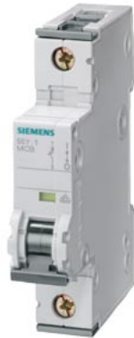
jistič 230/400V 10kA, 1pól., C, 13A, h=70mm