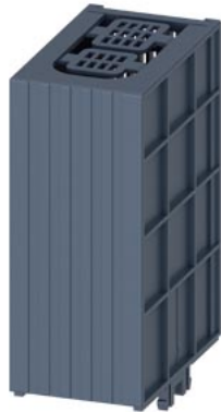
SENTRON, kryt svorek pro 3KF2