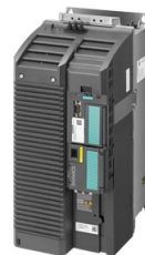
Podobné zobrazení / Figure similar

Č. zakázky zákazníka / Client order no.: