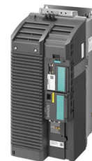
Podobné zobrazení / Figure similar