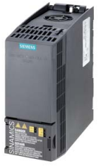
Podobné zobrazení / Figure similar

Č. zakázky zákazníka / Client order no.: