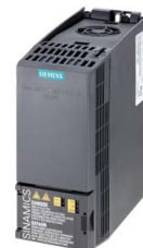
Podobné zobrazení / Figure similar