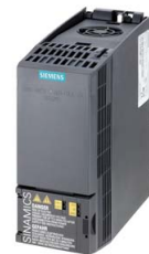
Podobné zobrazení / Figure similar

Č. zakázky zákazníka / Client order no.: